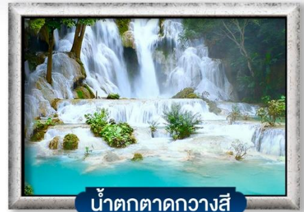
น้ำตกตาดกวางสี