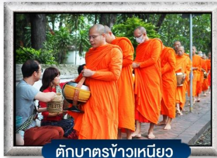
ตักบาตรข้าวเหนียว